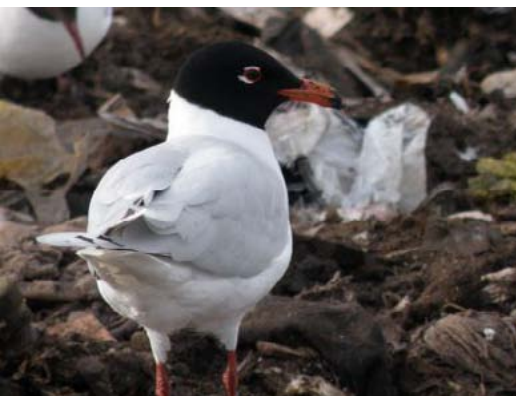
Melngalvas kaija Larus melanocephalus , 3.04., Getliņi, Stopiņu novads

Latvijā šis ir sugas 11 novērojums, pirmo reizi konstatēta 1970. gadā. Dāņu putnu pētnieks Edijs Frics katru gadu migrāciju laikā dodas uz Getliņu izgāztuvi nolasīt kaiju gredzenus, jo pēta kaiju izplatību.