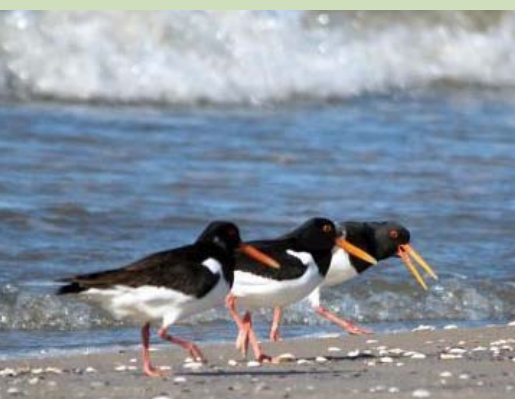
Jūras žagatas Haematopus ostralegus , 23.03., Liepāja

Piektais agrākais novērojums pavasarī. Latvijā ligzdo 50 līdz 80 pāri. Ligzdo gar upēm (sevišķi Daugavu) un liedagiem. Pavasarī un rudenī nelielā skaitā arī caurceļo.