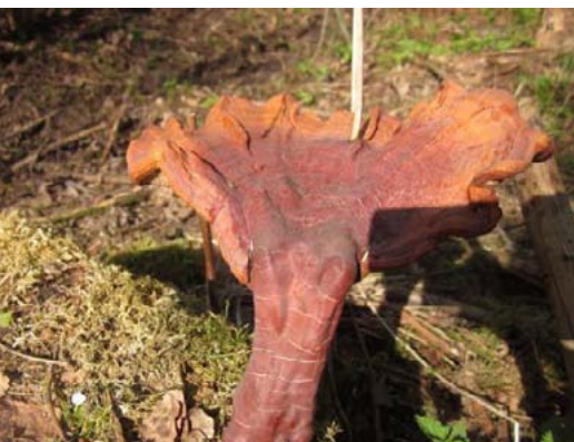
Lakas plakanpiepe Ganoderma lucidum , 30.04., Vitrupe

Pavasara sēne, kura līdz šim uzskatīta par visai retu, taču šajā pavasarī saņemti 5 ziņojumi par šīs sēnes atradnēm (pat simtiem auglķermeņu vienuviet).