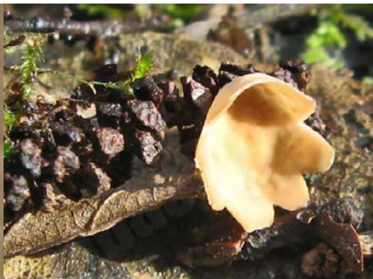
Spurdžu ciborija Ciboria caucus , 22.03., Rīgā pie Lāčupītes

Vienas no pirmajā pavasara sēnēm, tikai 1mm - 1cm platas. Sēņu attīstībai nepieciešamas vīrišķo ziedu spurdzes, kurās sēne parazitē. Tādēļ aug alkšņu, lazdu, apšu un vītolu tuvumā.