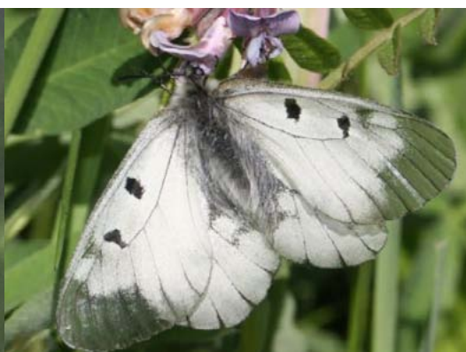
Cīrulīšu dižtauriņš Parnassius mnemosyne , 28.05., Drabešu pagasts Latvijā sastopama ļoti reti, aizsargājama un Latvijas Sarkanās grāmatas 1. kategorijas suga. Parasti dzīvo nelielu upju senlejās, kur meža zemsegā aug blīvguma cīrulītis - kāpura barības augs.