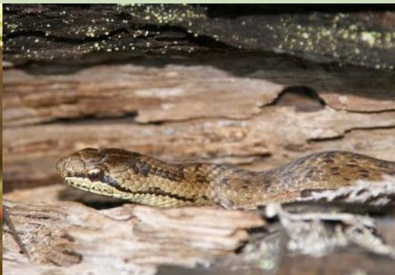
2012. gada dzīvnieks - gludenā čūska Coronella austriaca

Aprīlī - maijā saņemti jau 43 ziņojumi par gada kukaini! Spožā skudra sastopama visā Latvijā, bet novērojumu skaits ir nevienmērīgs. Tipiska sugas pazīme ir no aizmugures ieliekta galva, ko var novērot arī bez palielinājuma. Vērtīgi arī būtu iegūt papildus ziņas par sugas dzimumpaaudzes izlidošanas periodu Latvijā. Līdz šim konstatētais dzimumpaaudzes izlidošanas laiks ir jūnijs un jūlijs. Gaidām vēl jaunus ziņojumus!