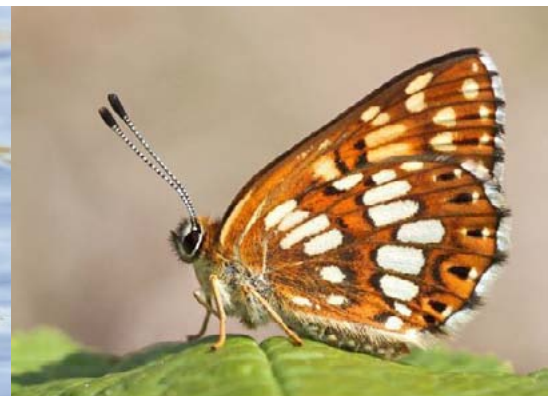
Gaiļbiksīšu sīkraibenis Hamearis lucina , 19.05., Čūžu purvs Reta un aizsargājama suga Latvijā, iekļauta Latvijas Sarkanajā grāmatā. Sastopams mežmalās, norās, krūmājos, gar ceļiem. Kāpurs dzīvo uz prīmulām.