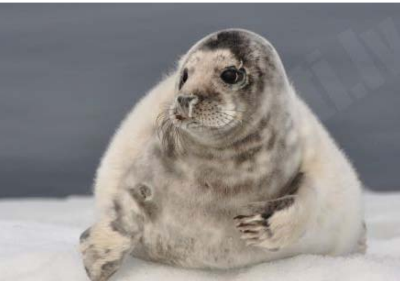
Pelēkais ronis, 17.03., Mangaļsala