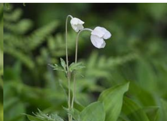
Meža (Daugavas) vizbulis Anemone sylvestris , 26.05., Lielie Kangari Gada augs 2012. Galvenokārt sastopams Daugavas ielejā. Tomēr paretam var sastapt arī citviet Latvijā, izņemot Kurzemi. Ziņoja/foto: Uģis Piterāns