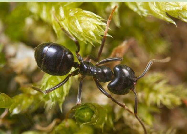
2012. gada kukainis - spožā skudra Lasius fuliginosus

Aprīlī - maijā saņemti jau 43 ziņojumi par gada kukaini! Spožā skudra sastopama visā Latvijā, bet novērojumu skaits ir nevienmērīgs. Tipiska sugas pazīme ir no aizmugures ieliekta galva, ko var novērot arī bez palielinājuma. Vērtīgi arī būtu iegūt papildus ziņas par sugas dzimumpaaudzes izlidošanas periodu Latvijā. Līdz šim konstatētais dzimumpaaudzes izlidošanas laiks ir jūnijs un jūlijs. Gaidām vēl jaunus ziņojumus!