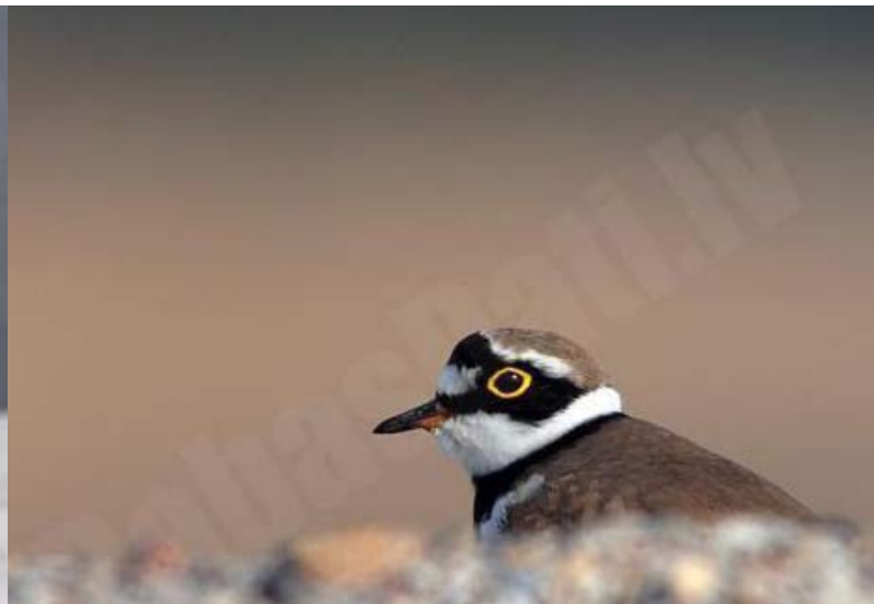
Upes tārtiņš Charadrius dubius , 22.04., Mērsrags