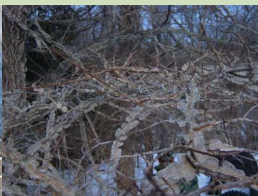
Stepes goba Ulmus minor f. suberosa , 18.03., Salas novads

Tautā to sauc arī par korķa gobu. Latvijas kokaugu atlantā korķa gobai minētas 18 atradnes - Višķos, Lazdukalnu dendroloģiskajā parkā u.c. lielākajos dendrārijos.