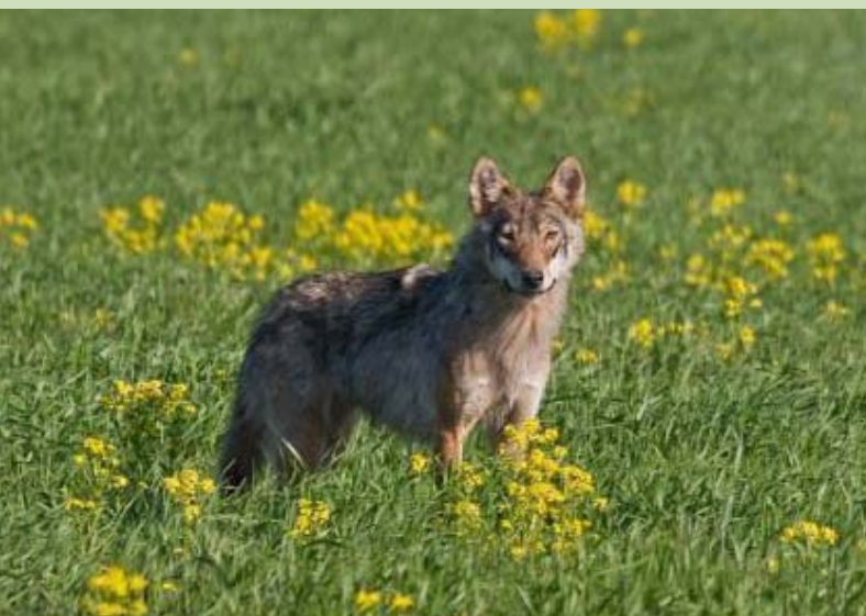
Vilks Canis lupus , 20.05., Užavas pag.