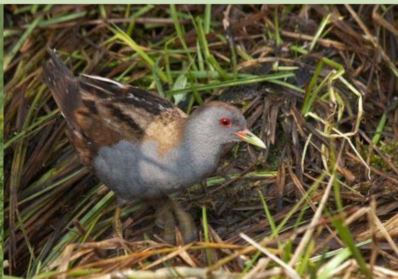
Mazais ormanītis Porzana parva , 04.05., Zvārdes pag.

Dabasdati.lv ir divu sabiedrisku dabas aizsardzības organizāciju - Latvijas Dabas fonda un Latvijas Ornitoloģijas biedrības - sadarbības programma. Dabasdati.lv aicina ikvienu dabas draugu ziņot par novērojumiem dabā - Latvijas savvaļas augu un dzīvnieku sugām. Ikviens var arī ievietot šeit dabā nobildēto, lai ar ekspertu palīdzību atpazītu novēroto. Tas ir interesanti pašam un lietderīgi dabas aizsardzībā strādājošajiem.