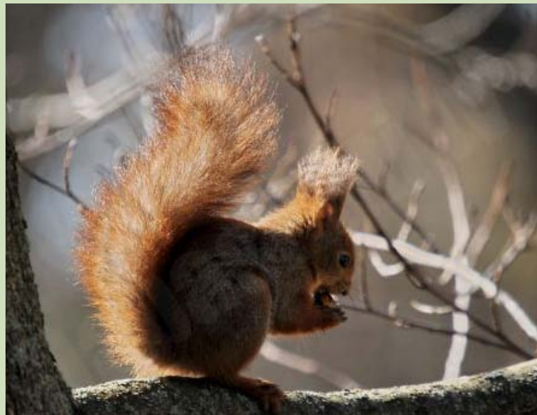
Vāvere Sciurus vulgaris , 26.03., Liepāja