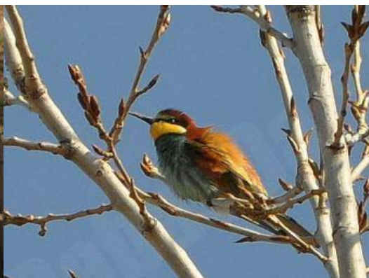
Bišu dzenis Merops apiaster , 24.04., Rīga, Vecdaugava

Reta un aizsargājama piepe. Aug uz lapukoku vai skujkoku celmiem. Interesanti, ka šī piepe jau tūkstošiem gadu tiek izmantota medicīnā Japānā un Ķīnā.