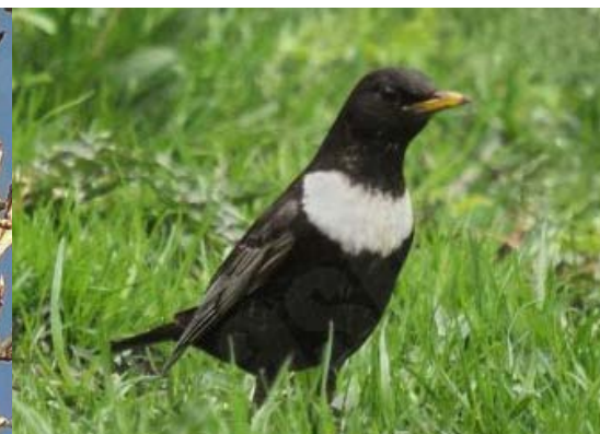
Apkakles strazds Turdus torquatus , 23.04., Liepāja

Agrākais šīs sugas novērojums pavasarī. Latvijā pirmā ligzdošana konstatēta 2003. gadā rietumu piekrastē Saraīku - Ziemupes apkārtnē. Ziņoja/foto: Igors Deņisovs