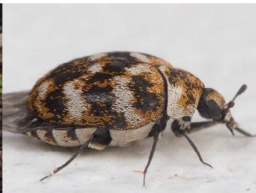
Ādgrauzis Anthrenus verbasci , 24.04., Rīga, Ilģuciems

Latvijā šis ir sugas 11 novērojums, pirmo reizi konstatēta 1970. gadā. Dāņu putnu pētnieks Edijs Frics katru gadu migrāciju laikā dodas uz Getliņu izgāztuvi nolasīt kaiju gredzenus, jo pēta kaiju izplatību. Ziņoja/foto: Ruslans Matrozis/Eddie Fritze