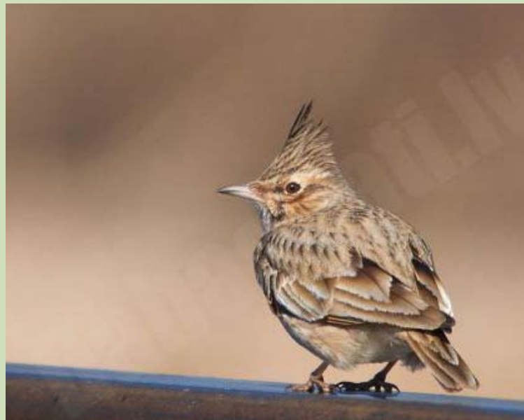
Cekulainais cīrulis Galerida cristata , 23.03., Liepāja