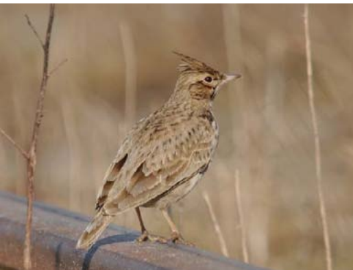
Cekulainais cīrulis Galerida cristata , 04.03., Liepāja

Latvijā ļoti rets ligzdotājs un nometnieks. Liepājā varētu ligzdot vismaz 10 pāri. Tie paši putni turpat pilsētā arī ziemo. Reti novērots citur Latvijā.