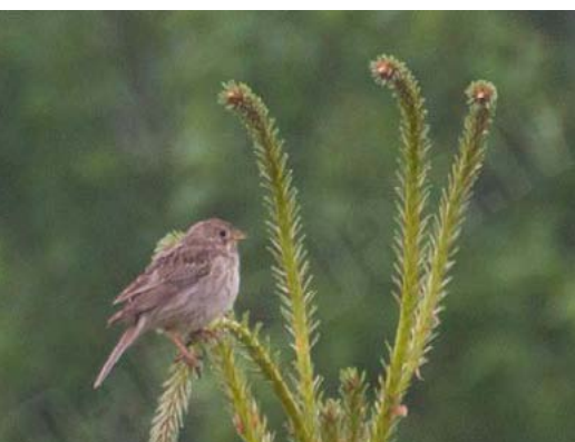
Lielā stērste Emberiza calandra , 28.05., Ciemupe Šai sugai 14. novērojums Latvijā kopš 1978. gada. Agrāk Latvijā, iespējams, ligzdojusi, bet tagad sastopama tikai kā reta iecelotāja. Ziņoja: Jānis Margevičs