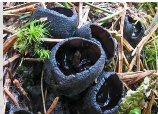
Melnā pseidoplektānija Pseudoplectania nigrella , 06.04., Krimuldas pagasts

Atrasta dzīvoklī uz palodzes. Varētu būt 2. atradne Latvijā! Pirmā atradne Ilgās, Daugavpils raj., 1991.g. Šī 3mm lielā vabolīte ir sastopama visā pasaulē un pricipā ir kaitēklis, jo barojas ar dabīgām šķiedrām - paklājiem, mēbelēm, drēbēm. Ziņoja/foto: Uģis Piterāns