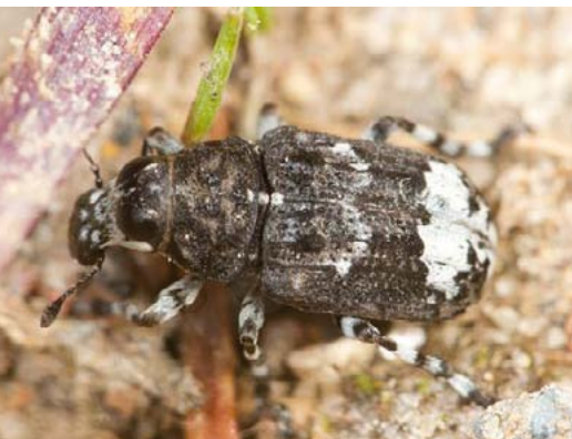
Platsmeceris Tropideres albirostris , 27.05., Skrīveru novads, Dendrārijs Latvijā reta suga - pirmo reizi konstatēta 2005. gadā un kopš tā laika atrasts ne vairāk kā 5 vietās.