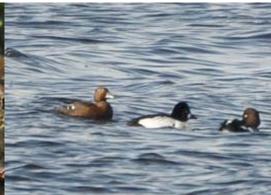
Stellera pūkpīle Polysticta stelleri , no 12.-18.03., starp Mangaļsalas un Daugavgrīvas moliem

Latvijā reta caurceļotāja un ziemotāja. Kopā ar lielajām gaurām, gaigalām novērota Daugavā, diezgan tramīga, līdz ar gaigalu pacelšanos lido līdz.