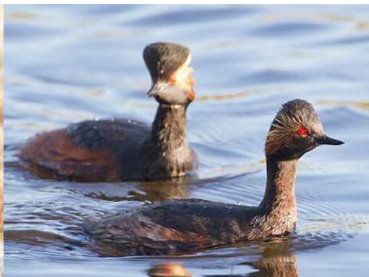
Melnkakla dūkuris Podiceps nigricollis , 02.05., Dārziņu atteka Latvijā rets ligzdotājs. Aptuveni 20-30 pāru ligzdo zivju dīķos pie Lubānas ezera.