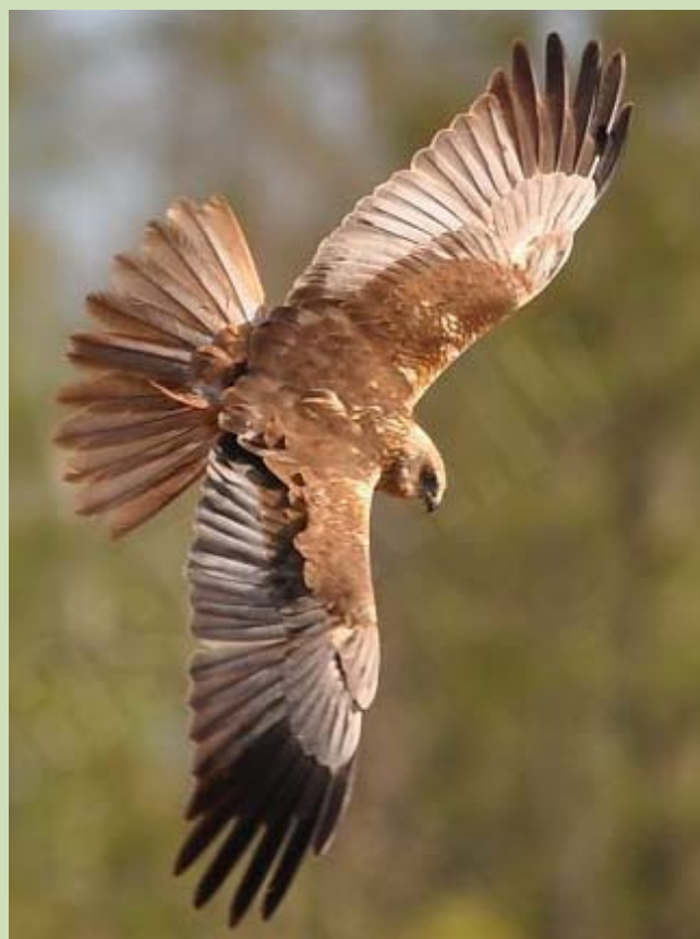
Niedru lija Circus aeruginosus , 13.05., Slampes pag.