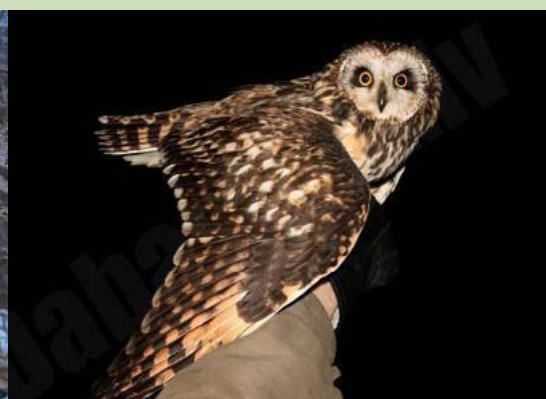
Purva pūce Asio flammeus , 29.03., Kolka

Noķerta gredzenošanai. Latvijā reta ligzdotāja. Ceļošanas laikā biežāk sastopama migrantu koncentrācijas vietās Kolkā (pavasarī) un Papē (rudenī). Atsevišķi īpatņi reti pārziemo.