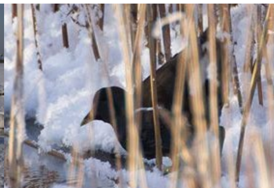
Ūdensvistiņa, Gallinula chloropus , 5.02., Salaspils novads, Dārziņi