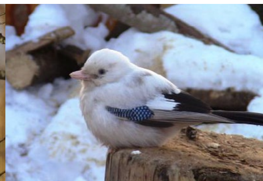
Sīlis, Garrulus glandarius , 20.02., Ogres novads, Glāzšķūnis

Daļēji albīns sīlis novērots šajā vietā jau kopš rudens.