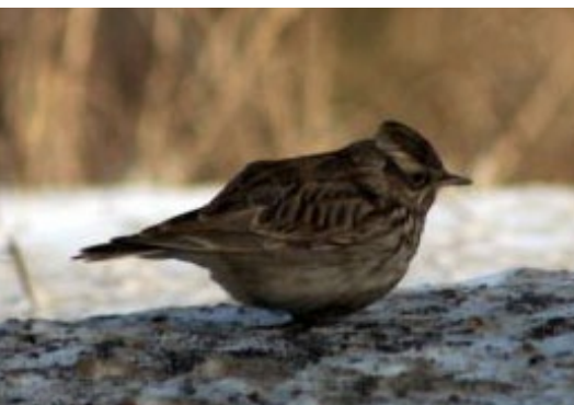
Sila cīrulīis, Lullula arborea , 4.02.