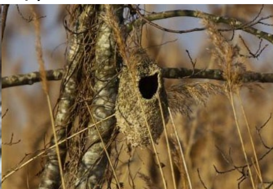
Somzīlītes ( Remiz pendulinus ) lietota ligzda, 9.02., Lāpmežciems, Kaņieris

Ligzdu būvē tēviņš no kārklu, papeļu, vilkvāļīšu u.c. augu ziedpūkām.