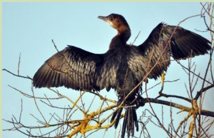
Mazais jūras krauklis, 1.02., Užavas upe

“Kadrā nav citu traucējošu putnu, forša gaisma, laba kompozīcija.”