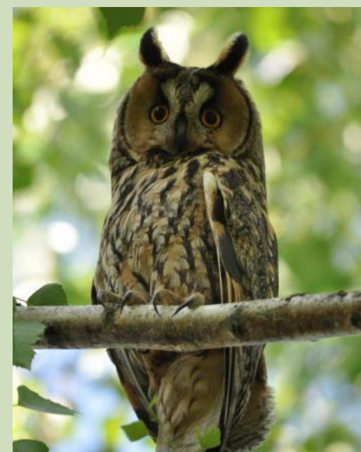
Ausainā pūce, Asio otus , 8.02., Rīga, Kundziņsala

Ziņoja: Mārcis Tirums (03.06.2011.)