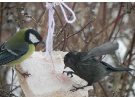
Lielā zīlīte, Parus major , 2.02., Gulbenes novads, Stāmeriena

Lai ziemā nenosaltu, zīlītes nakšņo pat skursteņos, kur ir sodrēji, kas iekrāso to apspalvojumu melnu.