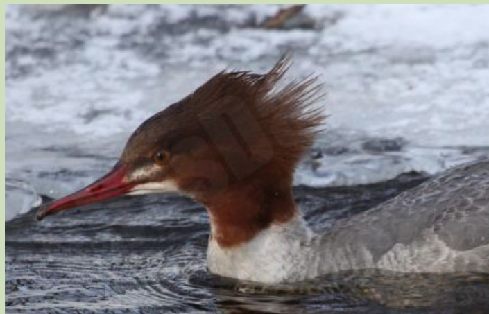
Lielā gaura, 15.02., Iecavas upe parkā

“Izdevies foto priekš putna, kuru parasti grūti ieraudzīt, kur nu vēl nofotografēt.”