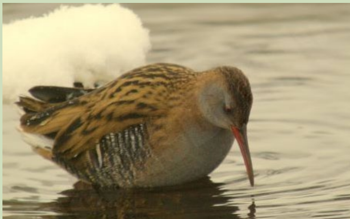
Dumbrcālis, 12.02., Ādažu poligons