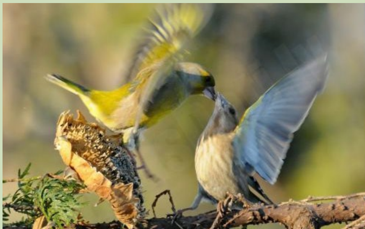
Zaļžubītes, 9.02., Liepāja

“Jauks putna tuvplāns. Lielās gauras ir diezgan tramīgi putni, kas fotogrāfu pārāk tuvu parasti nelaiž.”