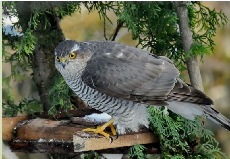
Zvirbuļu vanags.